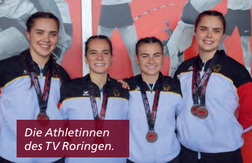
Die Athletinnen des TV Roringen.