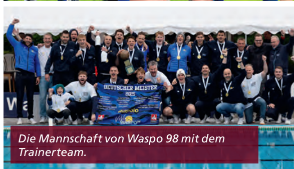
Die Mannschaft von Waspo 98 mit dem Trainerteam.