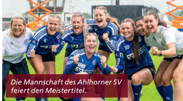
Die Mannschaft des Ahlhorner SV feiert den Meistertitel.