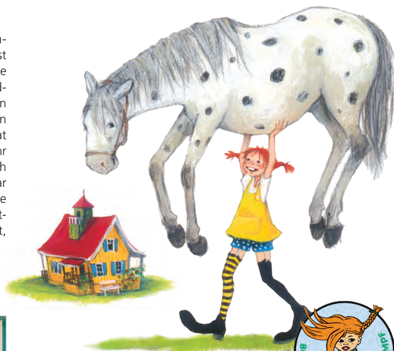
Illustrationen: Oetinger, Katrin Engelking