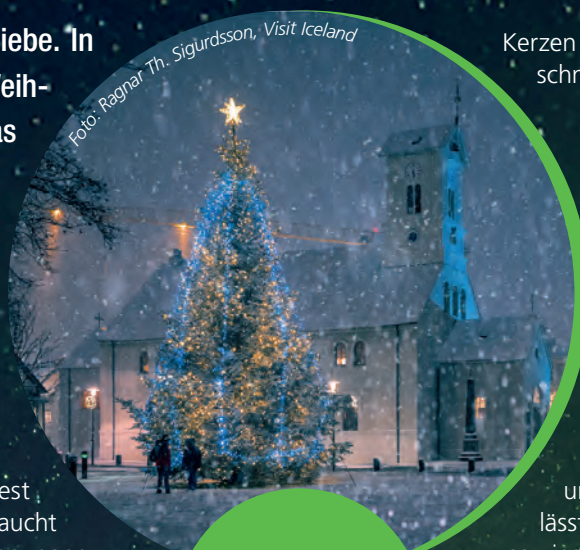
Weihnachtliche Stimmung vor dem Dom von Reykjavik.

Den Auftakt macht beispielsweise der Stekkjarstaur (deutsch Schafschreck) und stiehlt die Milch der Mutterschafe. Am 16. Dezember taucht dann der Pottaskefill (Topfschaber) auf. Er stibitzt die Essensreste aus den Kochtöpfen. Am 19. Dezember schleckt der Skyrgámur (Skyrslund) die Töpfe aus. Er hat eine Vorliebe für den Skeyr, ein seit einigen Jahren auch bei uns beliebtes joghurtähnliches isländisches Milchprodukt. Am 23. Dezember versucht dann der Ketkrókur (Fleischkraller) den Weihnachtsbraten zu stehlen. Und am Heiligen Abend muss man auf die