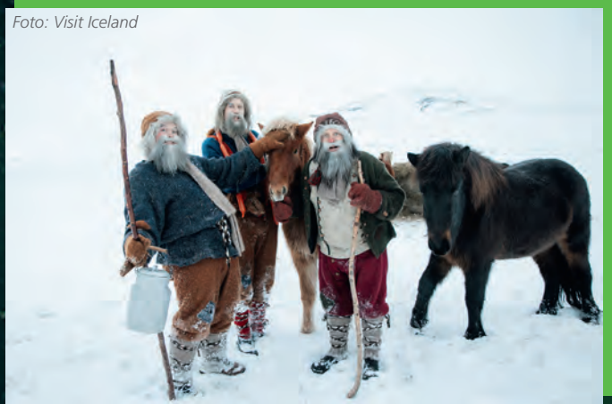
Weihnachten ist die Zeit der Trolle.

dass dort zur Winterzeit ein Weihnachtsmarkt isländischer Art stattfindet, bei dem Trolle die Hauptrolle spielen.