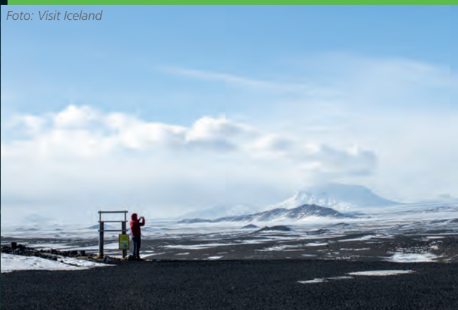
Schnee und Eis: Winterstimmung im isländischen Hochland.

sie es besonders auf faule Kinder abgesehen, die bis Weihnachten die Wolle noch nicht gesponnen haben. Wer dann am Aðfangadagskvöld, dem Heiligen Abend, ohne neue Kleidung dasteht, den holt sich die Katze. Diese dramatische Legende sollte die Kinder auf der unwirtlichen und kalten Insel dazu erziehen, sich rechtzeitig auf den harten Winter vorzubereiten. Auch heute sind die Eltern lieber vorsichtig und deswegen liegt traditionell auf jedem isländischen Gabentisch mindestens ein Kleidungsstück. Besonders gerne werden Socken verschenkt.