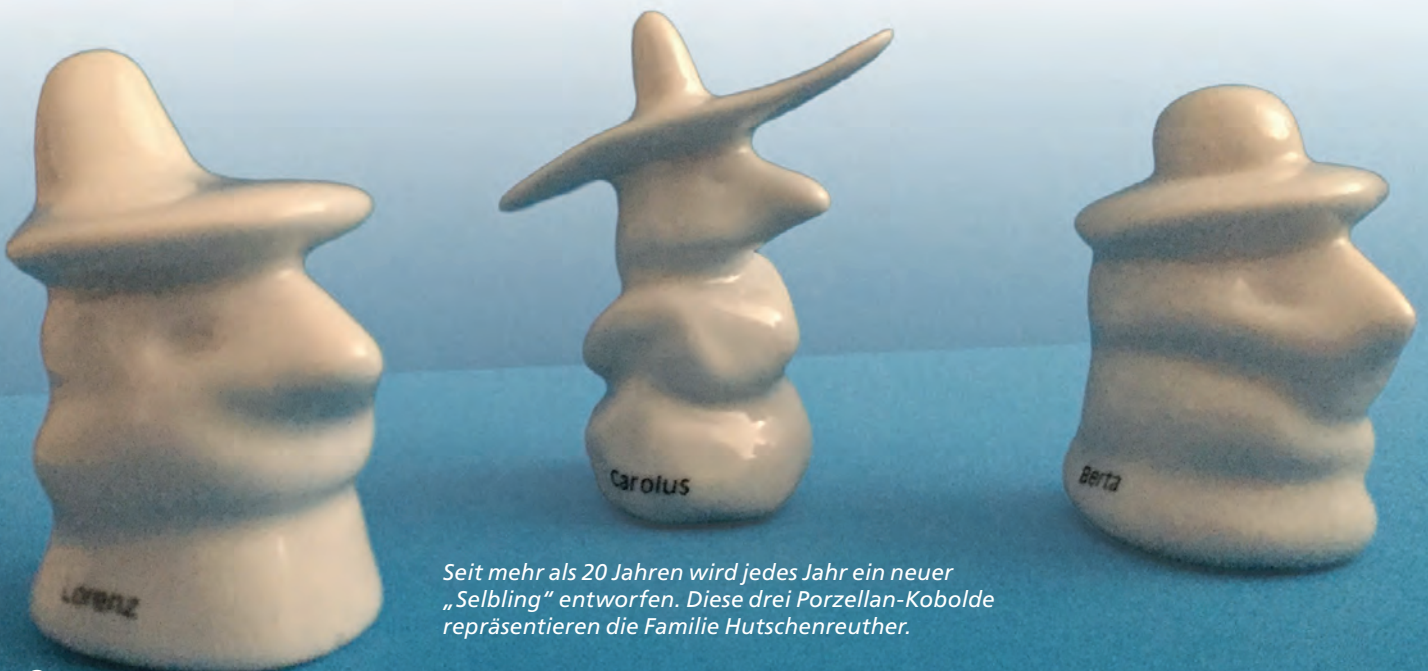
Seit mehr als 20 Jahren wird jedes Jahr ein neuer „Selbling“ entworfen. Diese drei Porzellan-Kobolde repräsentieren die Familie Hutschenreuther.