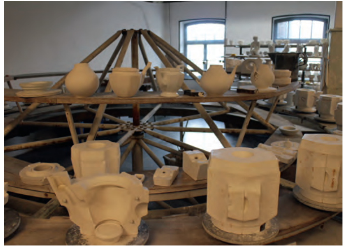
Gießkarussell mit Gipsformen zur Herstellung von Teekannen im „Porzellanikon“ in Selb.

schenreuther-Betriebe entwickelten sich fortan als zwei unabhängige Unternehmen mit Weltruf. Erst 1969 fusionierten sie zur Hutschenreuther AG. Im Jahr 2000 kam die Firma unter das Dach des Mitbewerbers Rosenthal, der inzwischen Teil eines italienischen Konzerns ist, aber weiterhin im Fichtelgebirge produziert.