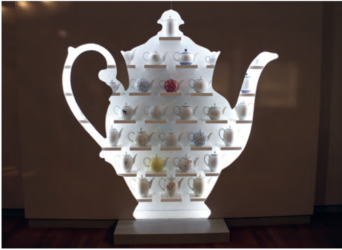
Im „Porzellanikon“ in Hohenberg an der Eger werden Tee- und Kaffeekannen unterschiedlicher Hersteller gezeigt.