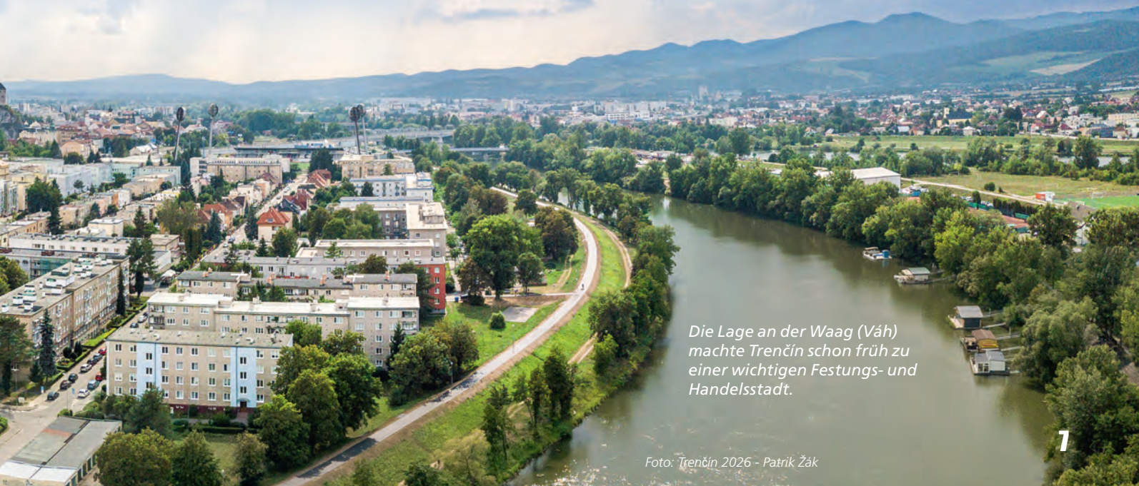
Die Lage an der Waag (Váh) machte Trenčín schon früh zu einer wichtigen Festungs- und Handelsstadt.