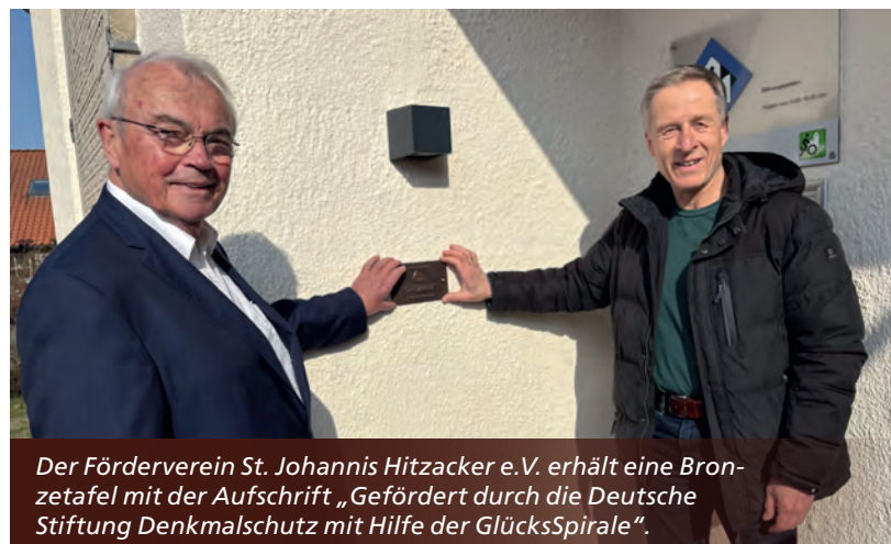
Der Förderverein St. Johannes Hitzacker e.V. erhält eine Bronzetafel mit der Aufschrift „Gefördert durch die Deutsche Stiftung Denkmalschutz mit Hilfe der GlücksSpirale“.

Die GlücksSpirale wurde 1970 eingeführt, um die Bauten der Olympischen Sommerspiele 1972 in München und Kiel mitzufinanzieren. Die Zweckabgaben der Lotterie – seit ihrem Bestehen bundesweit insgesamt über 2,6 Mrd. € – werden für gemeinnützige Projekte insbesondere in den Bereichen Sport, Denkmalschutz und Wohlfahrt sowie für Projekte regionaler Organisationen verwendet.