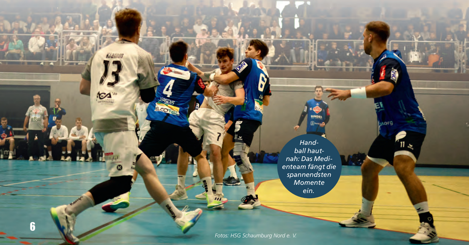
Handball hautnah: Das Medienteam fängt die spannendsten Momente ein.

Die GlücksSpirale wurde 1970 eingeführt, um die Bauten der Olympischen Sommerspiele 1972 in München und Kiel mitzufinanzieren. Die Zweckabgaben der Lotterie – seit ihrem Bestehen bundesweit insgesamt über 2,6 Mrd. € – werden für gemeinnützige Projekte insbesondere in den Bereichen Sport, Denkmalschutz und Wohlfahrt sowie für Projekte regionaler Organisationen verwendet.