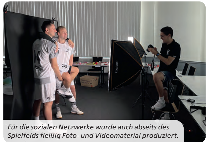
Für die sozialen Netzwerke wurde auch abseits des Spielfelds fleißig Foto- und Videomaterial produziert.

Über die operativen Erfolge hinaus leistete das Projekt einen wesentlichen Beitrag zur Stärkung der regionalen Engagement-