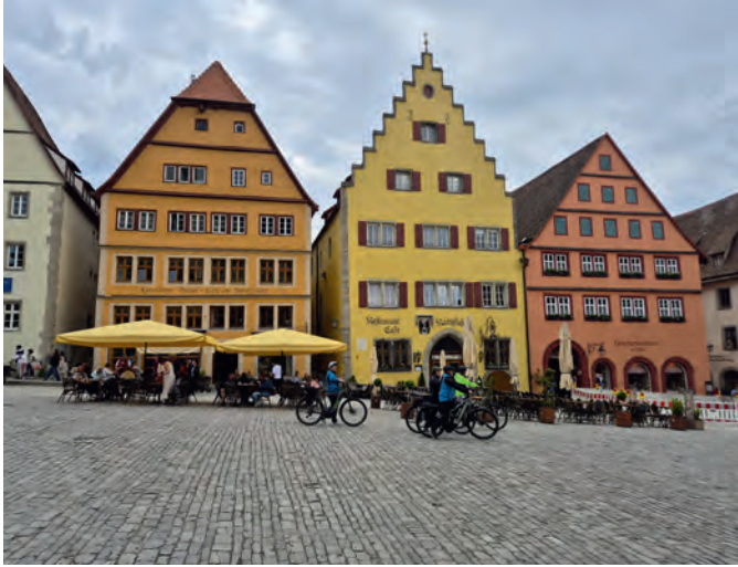
Der Marktplatz ist das romantische Zentrum von Rothenburg ob der Tauber.