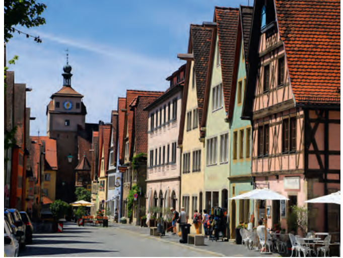
Der Weiße Turm gehört zur inneren Stadtmauer. In seiner Nähe liegen viele Restaurants.

nehmen, am Ende landen alle auf dem Marktplatz. Umrahmt von prächtigen Patrizierhäusern und dem imposanten Rathaus, ist er das Herz der Stadt. Bevor sie die 220 Stufen zur Aussichtsplattform des 60 Meter hohen Rathauses erklimmen, stärken sich die meisten unten am Platz in einem der vielen Cafés und Restaurants. Oben belohnt der 360-Grad-Blick über die Altstadt und das Taubertal die Mühe. Schon 1893 diente das Rathaus als Vorbild für den deutschen Pavillon auf der Weltausstellung in Chicago.