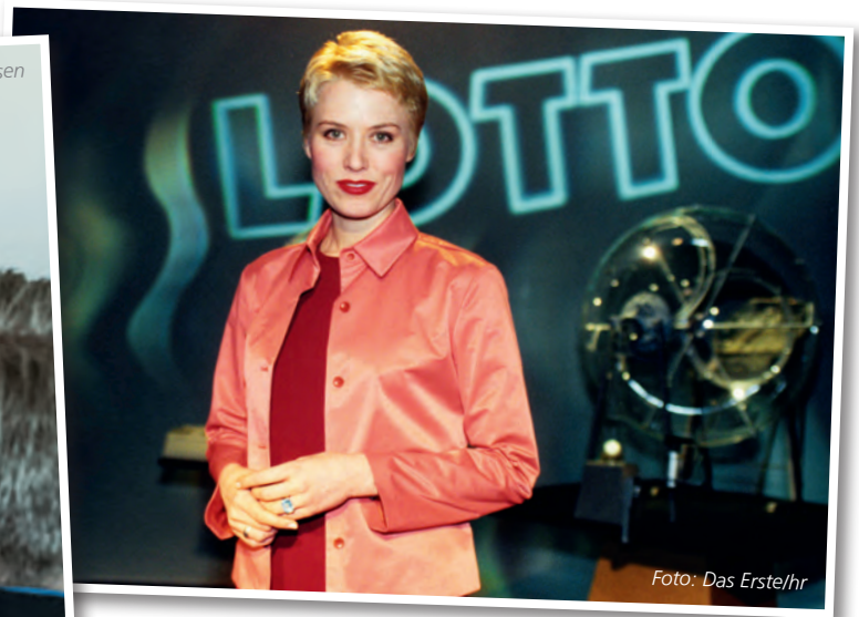
Rückblende: 1998 übernahm Franziska Reichenbacher den Staffelstab als Moderatorin bei „Lotto im Ersten“.

annimmt. Feen und Elfen sind Fabelwesen, wandelbare Naturgeister aus Zwischenwelten, sie passen perfekt in unsere Zeit, in der wir aus alten Rollenbildern herauswachsen und neue Rollenbilder finden müssen, für uns selbst, aber auch im Zusammenspiel mit anderen Menschen. So wissen wir zum Beispiel inzwischen, dass Vielfalt nicht nur gerechter, sondern auch erfolgsversprechender ist. In Teams wird zum Beispiel besser gearbeitet, wenn sie divers zusammengesetzt sind, jung und alt, Männer und Frauen, Menschen unterschiedlicher Herkunft sich in ihren Talenten ergänzen. Dazu gibt es viele Studien.