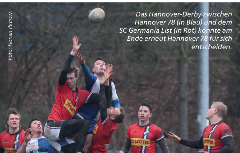
Das Hannover-Derby zwischen Hannover 78 (in Blau) und dem SC Germania List (in Rot) konnte am Ende erneut Hannover 78 für sich entscheiden.

sächsischen Landeshauptstadt dabei. In der zehn Teams umfassenden eingleisigen ersten Liga liegen beide Mannschaften aber relativ weit auseinander: Die 78er waren Mitte vergangener Woche Tabellenvierter, die Germanen aus dem Stadtteil List Achter.