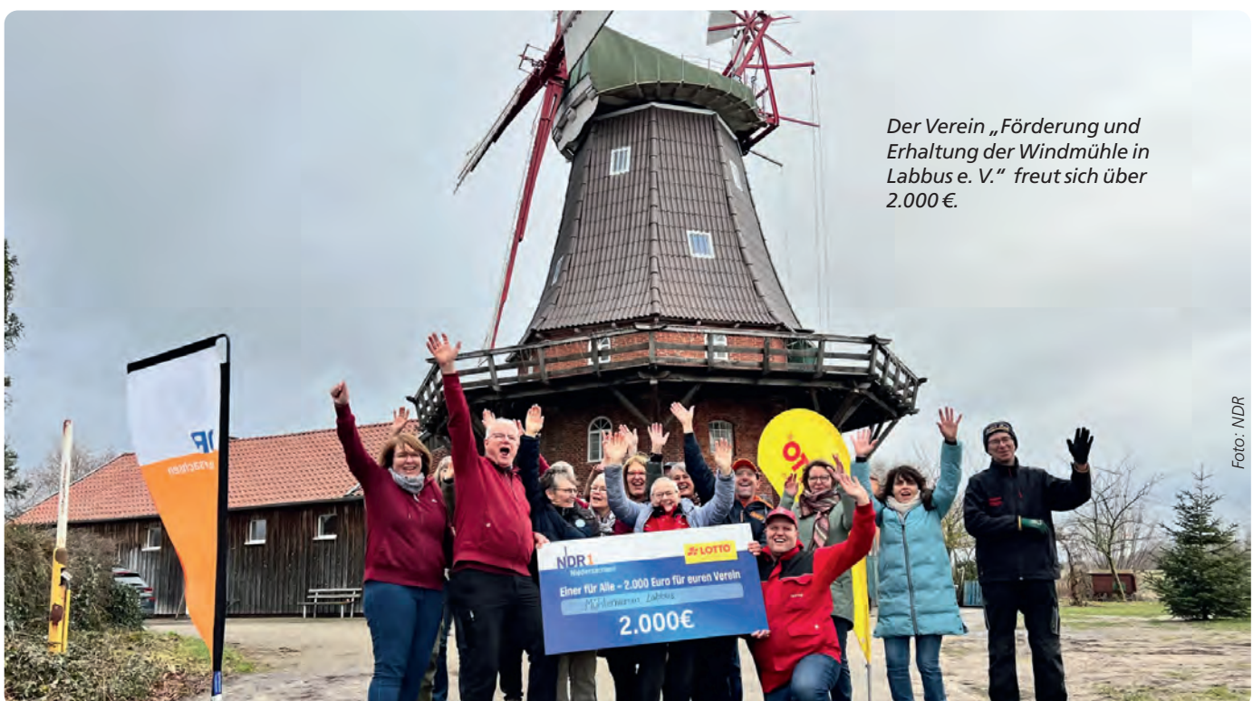
Der Verein „Förderung und Erhaltung der Windmühle in Labbus e. V.“ freut sich über 2.000 €.

Mitmachen bei „Einer für Alle“ kann jedes volljährige Vereinsmitglied aus Niedersachsen. Wird der eigene Name in der Morningshow live im Radio genannt, heißt es: schnell anrufen und den Gewinn sichern! Nur wer sich rechtzeitig meldet, bringt das Geld in den eigenen Verein.