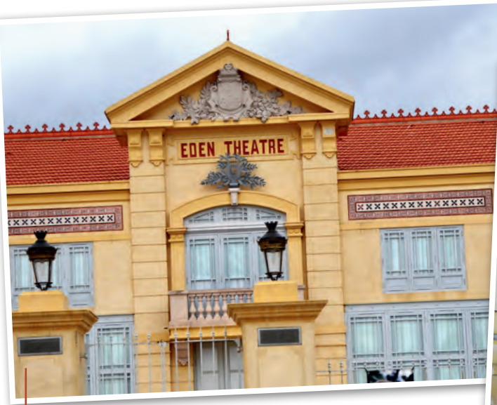
Das Kino Eden-Théâtre, erbaut 1889. Ein Wandbild zeigt den ankommenden Zug im Film der Brüder Lumière.