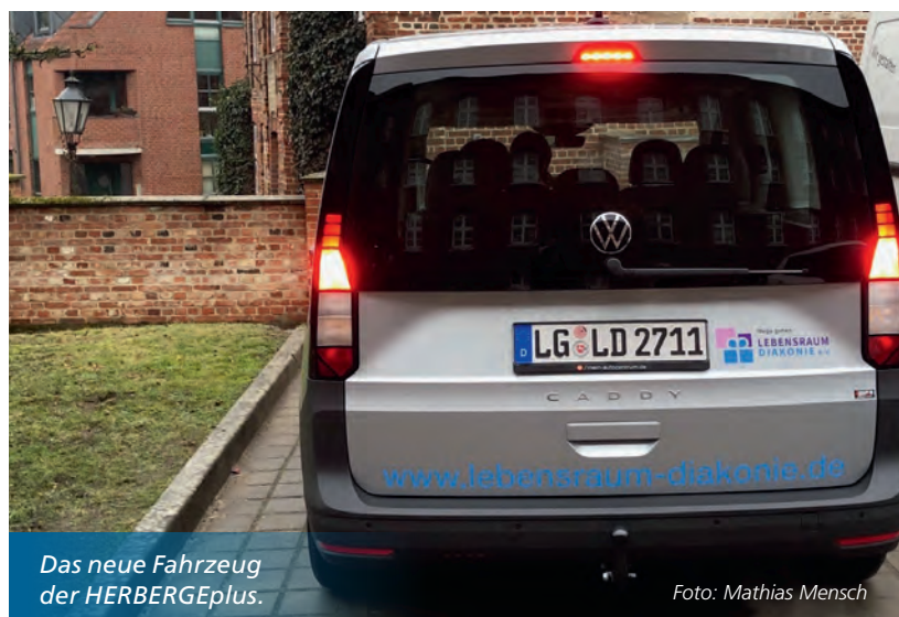
Das neue Fahrzeug der HERBERGEplus.

Die GlücksSpirale, 1970 zur Mitfinanzierung der Olympischen Sommerspiele 1972 in München und Kiel eingeführt, hat seitdem insgesamt über 2,6 Mrd. € für gemeinnützige Projekte in den Bereichen Sport, Denkmalschutz, Wohlfahrt und regionale Organisationen bereitgestellt.